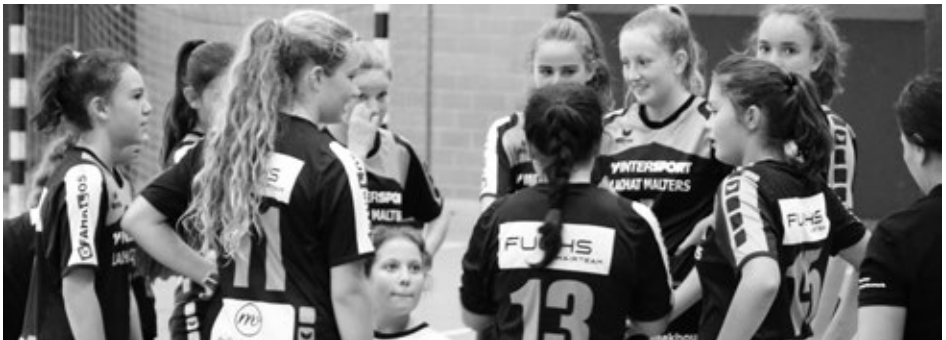
Teambesprechung (Manchmal kamen auch noch andere Themen dazu...)

Den Spielstart hatten die KBH Gils wieder einmal verschlafen. Ähnlich wie beim Spiel gegen die Köniz Cat's liesen wir uns zu sehr einschüchtern. Nach 20 Minuten kamen wir endlich ins Spiel. Grandios wie die KBH Girls die acht Tore Rückstand in einen ein-