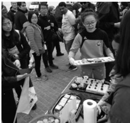
Kuchen verkaufen für die Saisonabschlussreise. Auch hier zeigten die SG KBH Mädchen vollen Einsatz! Stolze 1755 Franken haben sie dabei verdient.

Herzlichen Dank für die tolle Saison 2018/2019!